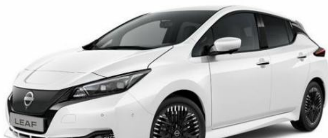
Экстерьер: Pearl White